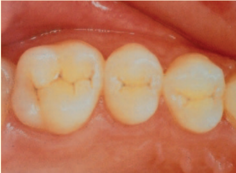
Fissuren der Backenzähne

Fissuren sind kleine Rillen und Furchen in den Kauflächen der Backenzähne. Hier sammeln sich Bakterien an, die Karies verursachen können. Die Fissurenversiegelung ist eine wissenschaftlich anerkannte und bewährte Maßnahme, um die Backenzähne davor zu schützen.