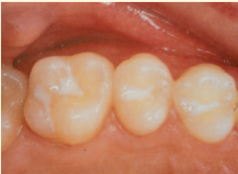
Versiegelte Fissuren der Backenzähne

Je tiefer und enger diese Fissuren sind, desto stärker ist der Zahn kariesgefährdet. Auch die sorgfältigste Zahnpflege reicht nicht aus, da die Borsten der Zahnbürste meist nicht ganz bis auf den Grund der Fissuren hinabreichen.